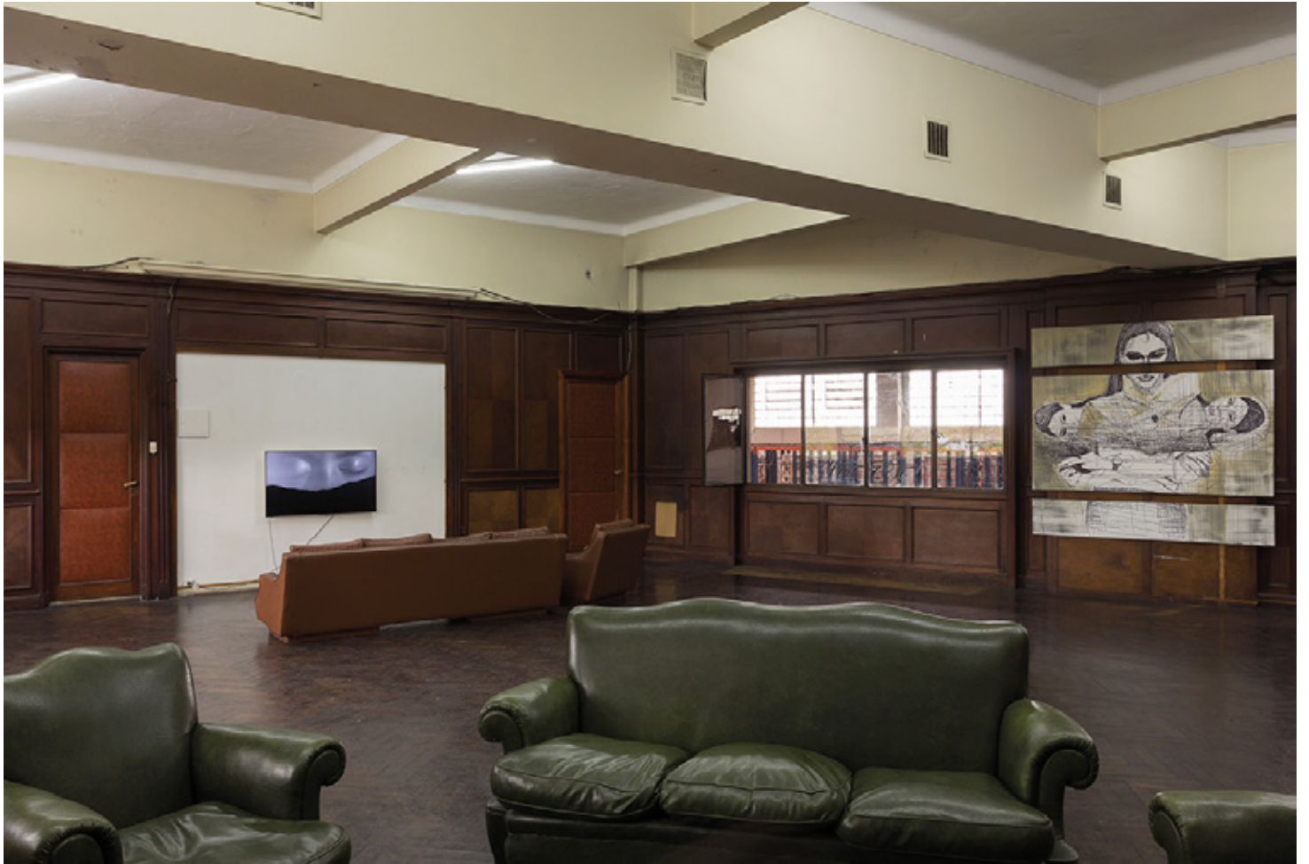
Humanas, Vista de la instalación Isla Flotante, Buenos Aires 2018