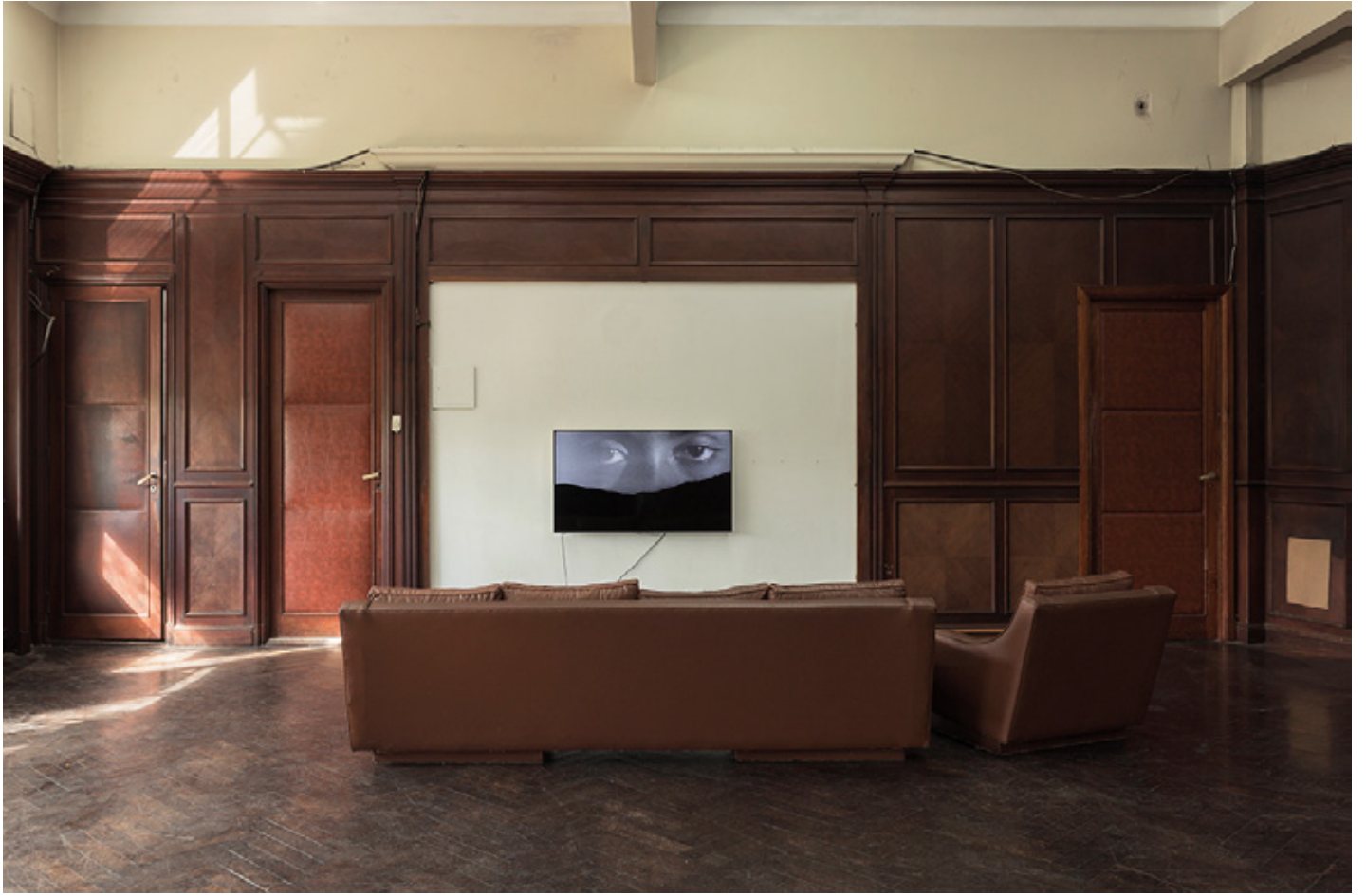
Humanas, Vista de la instalación Isla Flotante, Buenos Aires 2018