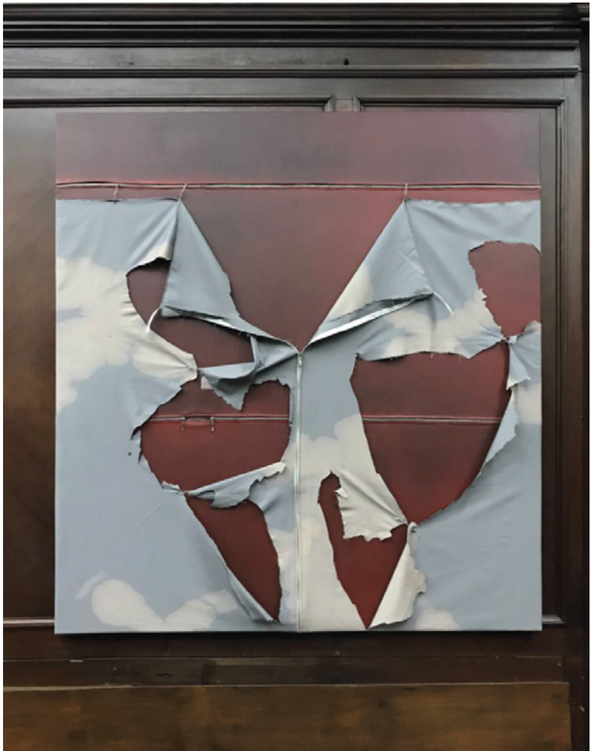
Noooooo Fragmento Noooooo #3 (Conjunto de 7 pinturas) 2017/18