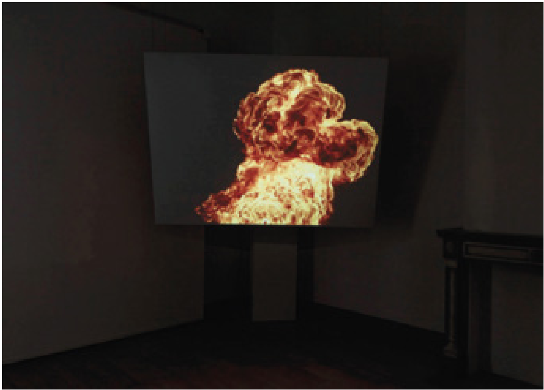
Rio de Janeiro, 5' , 2017 16mm transferred to video https://vimeo.com/234410229 (password: laranja) AVAILABLE