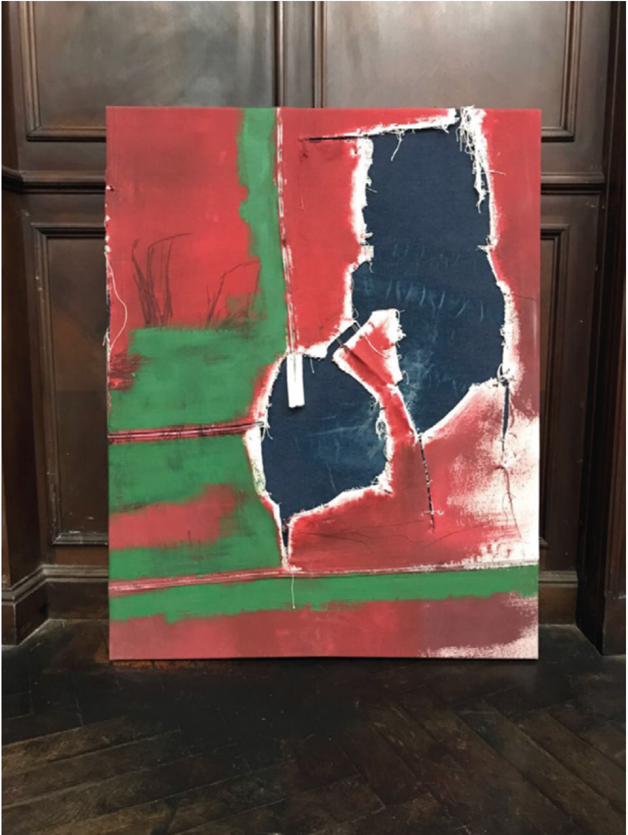
Formas de devoción Lavandina, tinta y tela 145 x 120 cm 2017