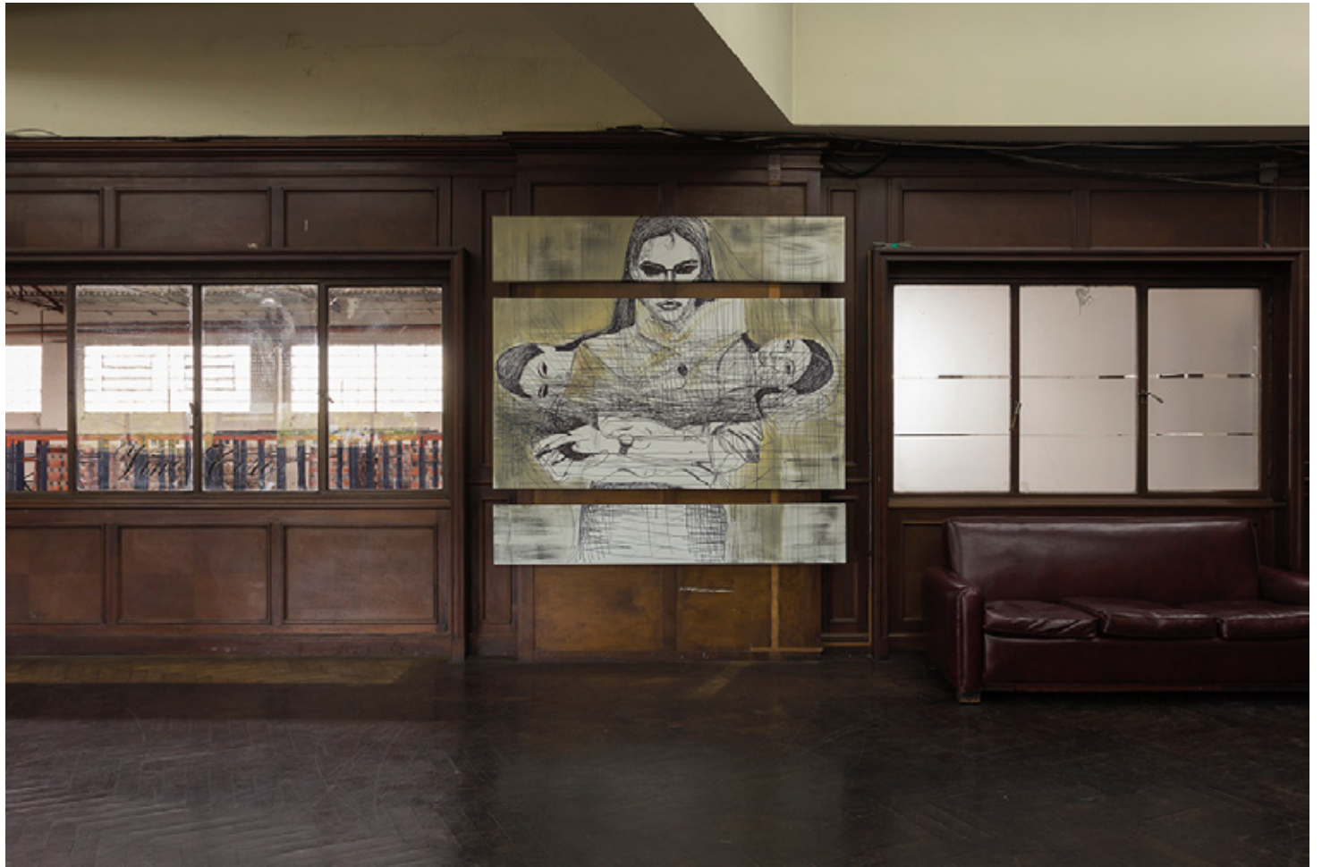
Noooooo Fragmento Noooooo #2 (Conjunto de 7 pinturas) 2017/18