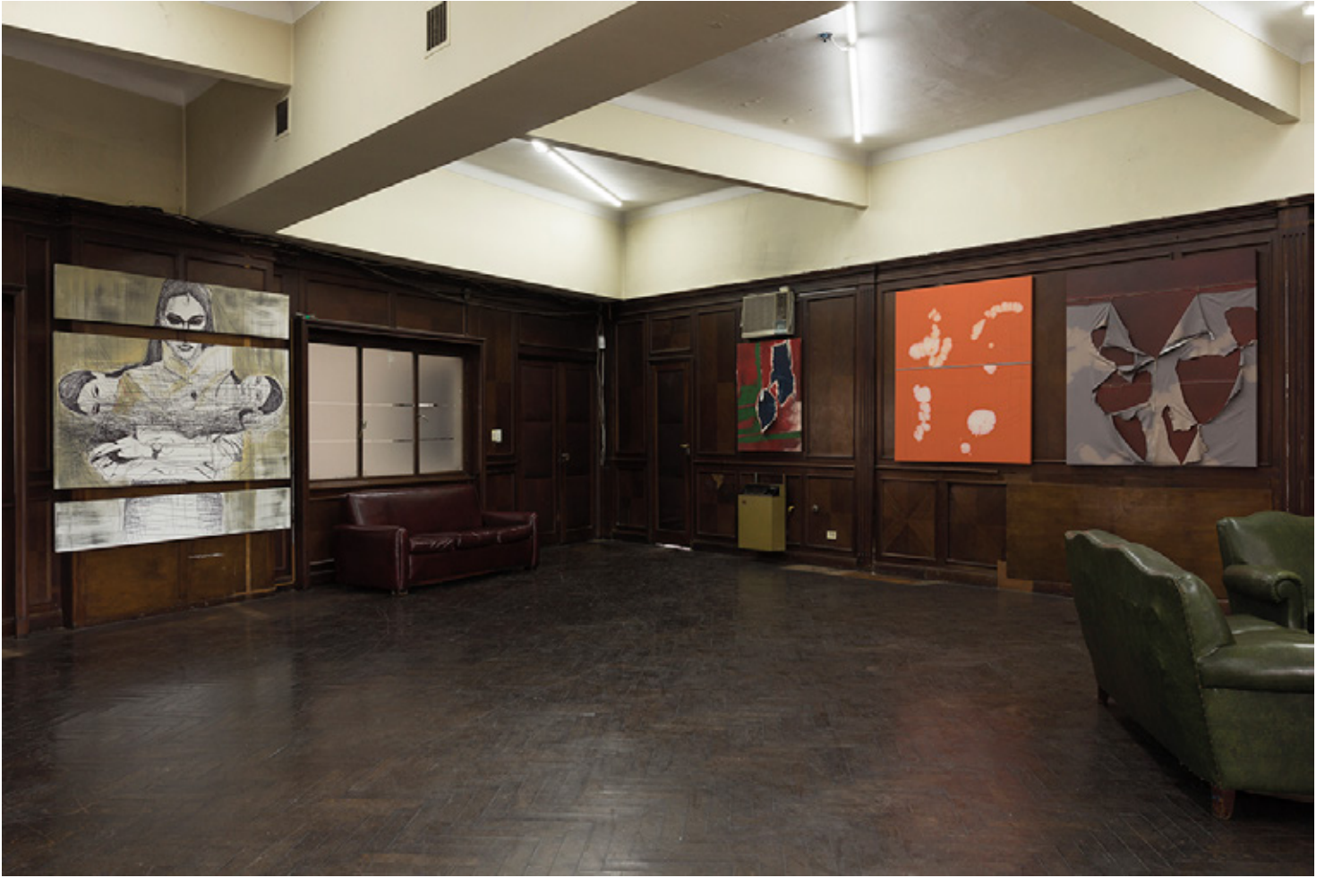
Humanas, Vista de la instalación Isla Flotante, Buenos Aires 2018