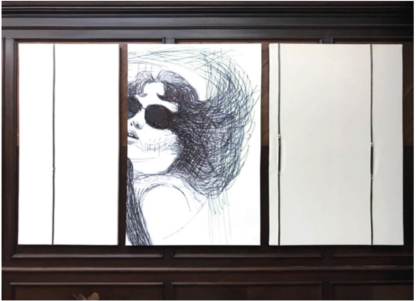
Noooooo Fragmento Noooooo #1 (Conjunto de 7 pinturas) 2017/18