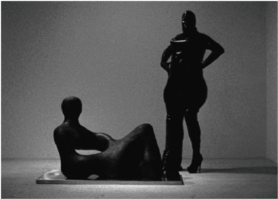
Modern, 4' , 2014 16mm transferred to video https://vimeo.com/114274149 (password: preto) NOT AVAILABLE