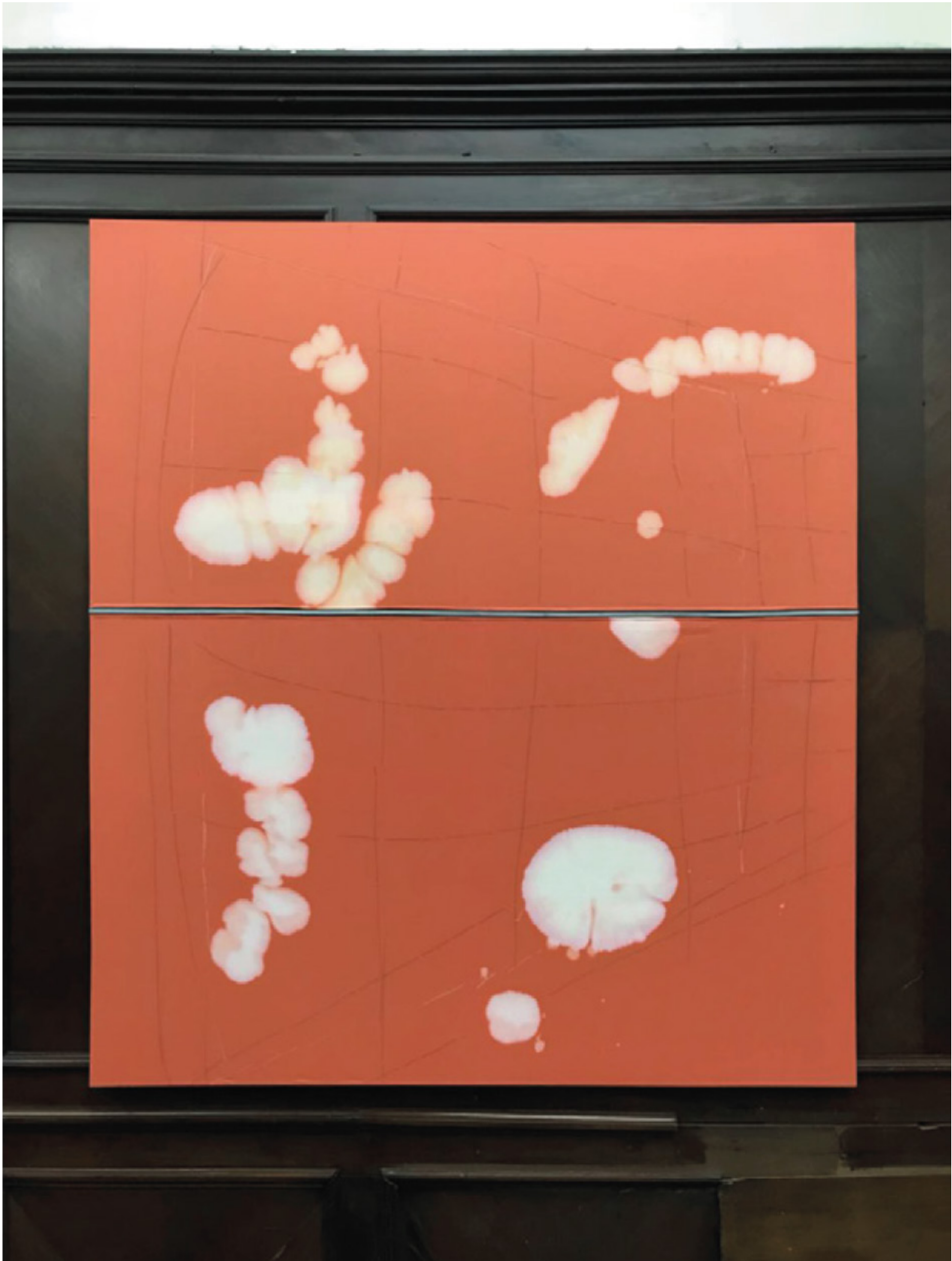
Hecho a mano Lavandina, tinta y tela 145 x 120 cm 2017